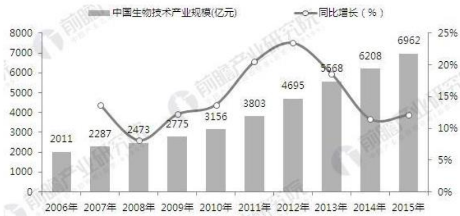
2006-2015年中国生物技术产业规模及增长情况 (单位: 亿元, %)