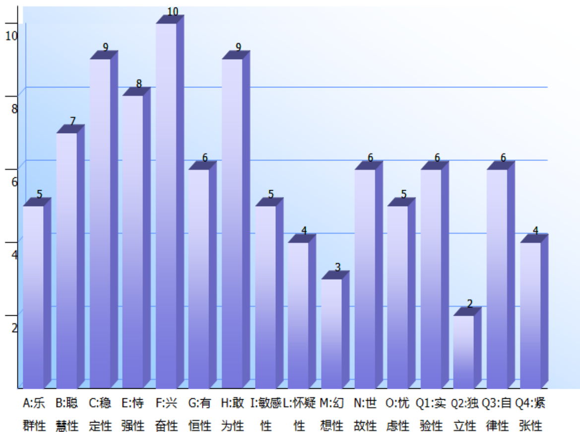
卡特尔 16 种人格因素问卷(卡特尔 16PF 测试)